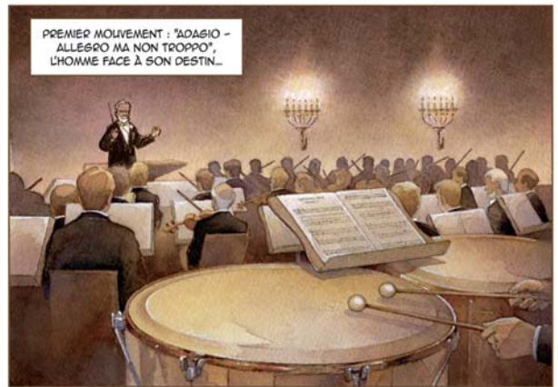
Planche 20 achevée