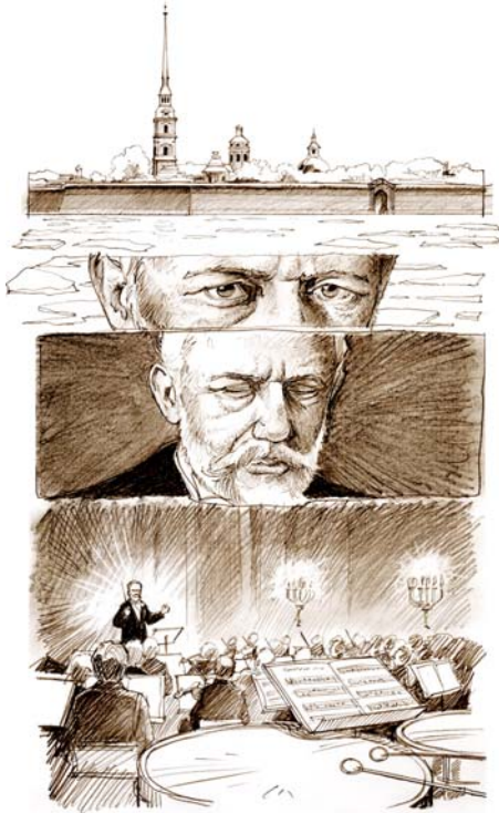
Croquis de la planche 20